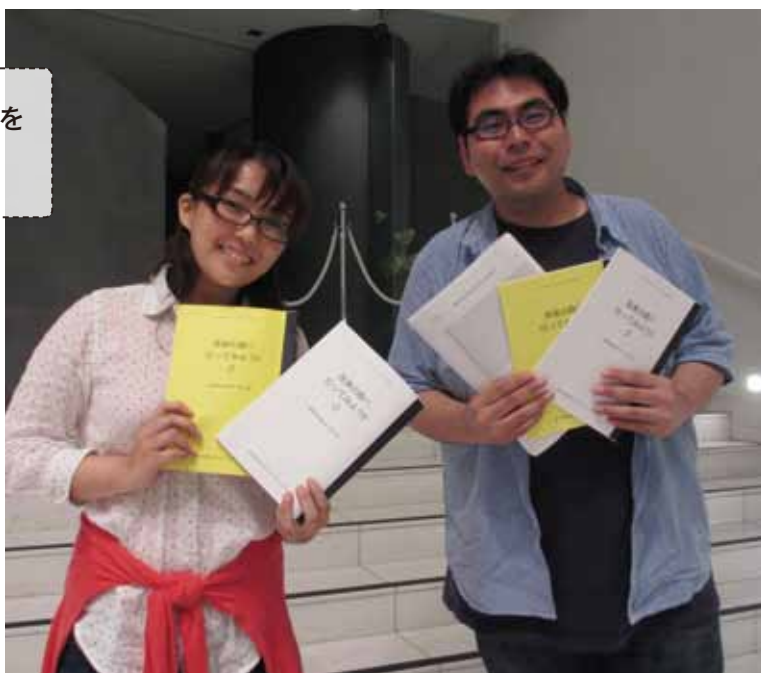
竹内 晶美 ミュージカル俳優