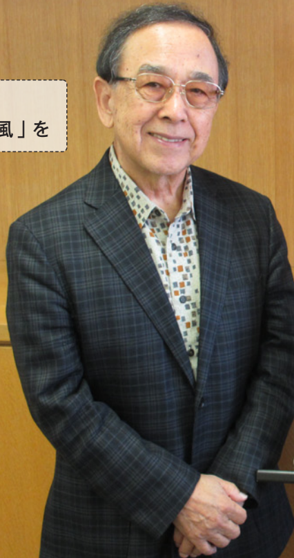
今田 勝 ピアニスト・作曲家